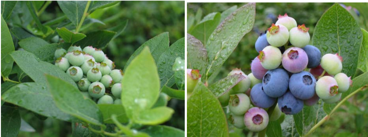
Şekil 5. Likapa meyve salkımları (koruk meyveler ve salkımdaki koruk, ben düşmekte olan ve olgunlaşmış taneler)