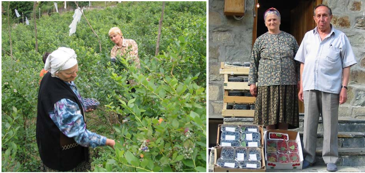
Şekil 7. Likapaların el ile doğrudan tüketici kaplarına toplanması ve kutulanmış meyveler

plastik, karton, ağaç kaplama veya kağıt hamurundan yapılmış olan kaplara doldurulur. Kabin üzerine gerilecek olan şeffaf film, su kaybını azaltırken meyveleri tozdan korur ve güzel görünmelerini sağlar. Bu kaplar daha sonra bir sırasinda 12 paket alan odundan yapılmış kafesli sandıklara doldurulur (Şekil 7 ve 8). Düz veya teraslanmış alanlarda likapa hasat makineleri kullanılabilir. Hasat makinesinin ekonomik olması için bahçenin en az 50 da olması gerekir. Ancak, makineli hasatta meyveler zarar görebileceği, olgunlaşmamış meyveler de toplanabileceği ve meyvelerin raf ömrü azalacağı için işgücünün ucuz olduğu yerlerde el ile hasat tavsiye edilmektedir. Likapalar yağmurlu havalarda hasat edilmez ve hasat sonrası mutlaka ön soğutma yapılarak meyvelerin bahçe sıcaklığının düşürülmesi gerekir. Böylece meyvelerin raf ömrü artırılmış olur.