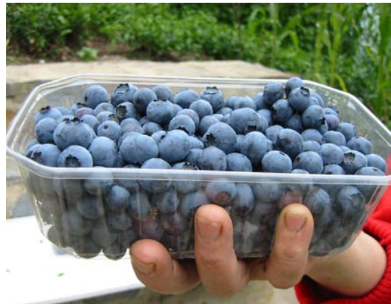
Şekil 2. Tüketici kaplarında ve taze olarak tüketilmek üzere pazara sunulan likapa meyveleri