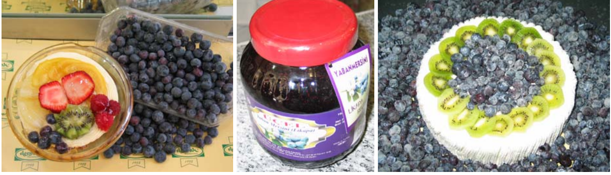
Şekil 3. Likapanın kullanım alanlarından likapalı punç, likapa reçeli ve likapalı yaş pasta