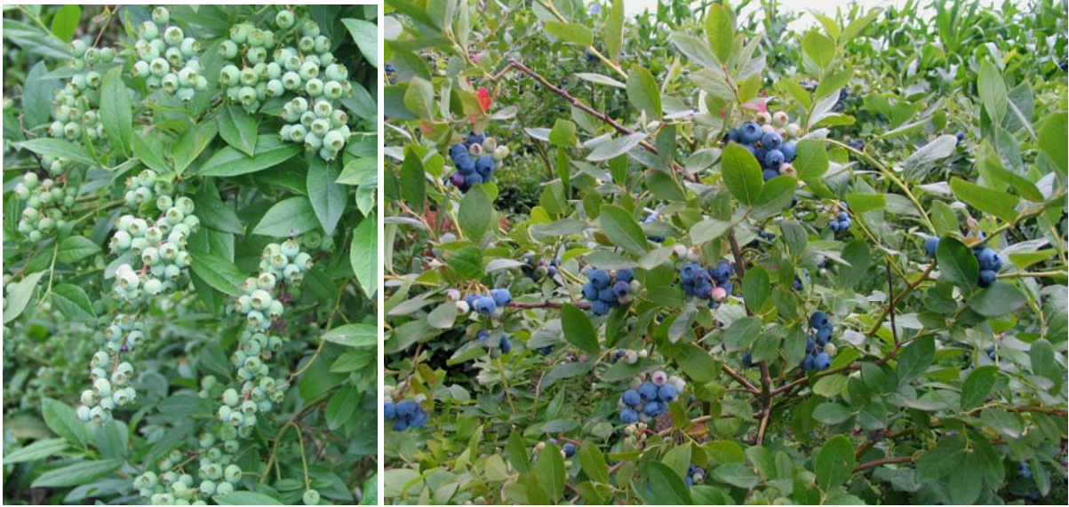
Şekil 4. Likapa bitkisi üzerindeki olgunlaşmamış meyve salkımları ve hasat edilebilir durumdaki mavi taneler

Karadeniz Bölgesinde 2000 yılında başlayan kapama likapa bahçesi tesisi 2005 yılında yurt dışından gelen 2 yaşlı tüplü fidanlarla hız kazanmış, Artvin, Rize, Trabzon, Giresun, Ordu, İstanbul ve Bursa illerinde yeni bahçeler tesis edilmiştir. Çok farklı kullanım ve değerlendirme şekillerinden dolayı tarıma dayalı sanayi kuruluşlarının da yakın ilgisini çeken likapa Rize’de ÜÇEL GIDA SAN. AŞ. Tarafından reçele işlenmiş ve mükemmel ilgi göyerek beğeni ile aranan bir ürün olmuştur. Likapa gibi diğer üzüksü meyvelerin de (ahududu, böğürtlen, Frenk üzümü, Bektaşı üzümü v.s.) bölgede yayılması amacıyla NUHOĞLU VAKFI tarafından Trabzon ili Hayrat ilçesinde yaklaşık olarak 20 da örnek meyve bahçesi tesis edilmiştir.