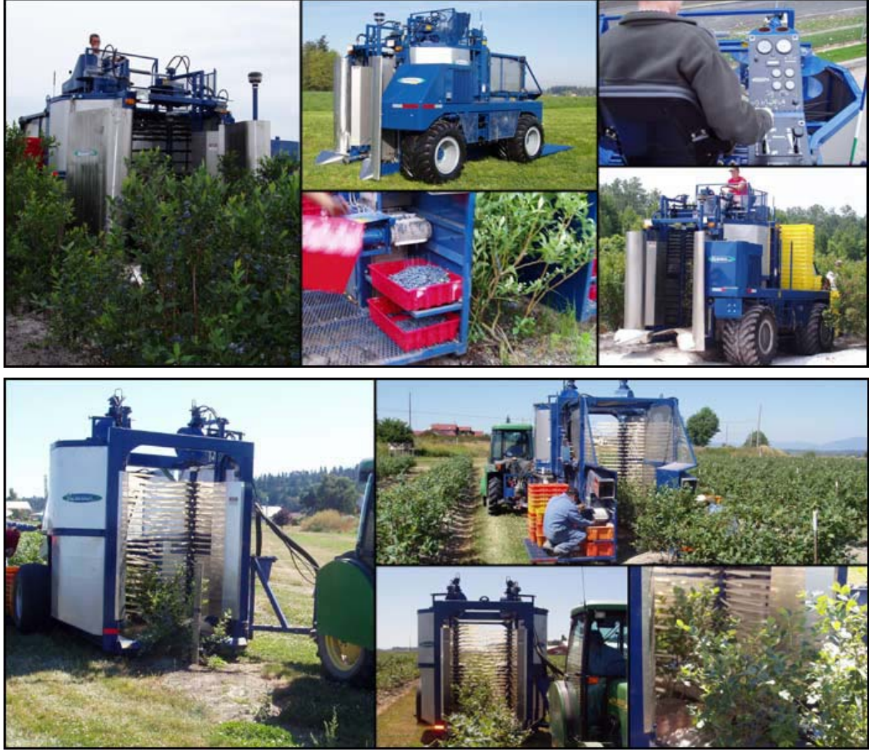
Şekil 8. Yüksek çalı formundaki likapalarda hasat yapan makineler