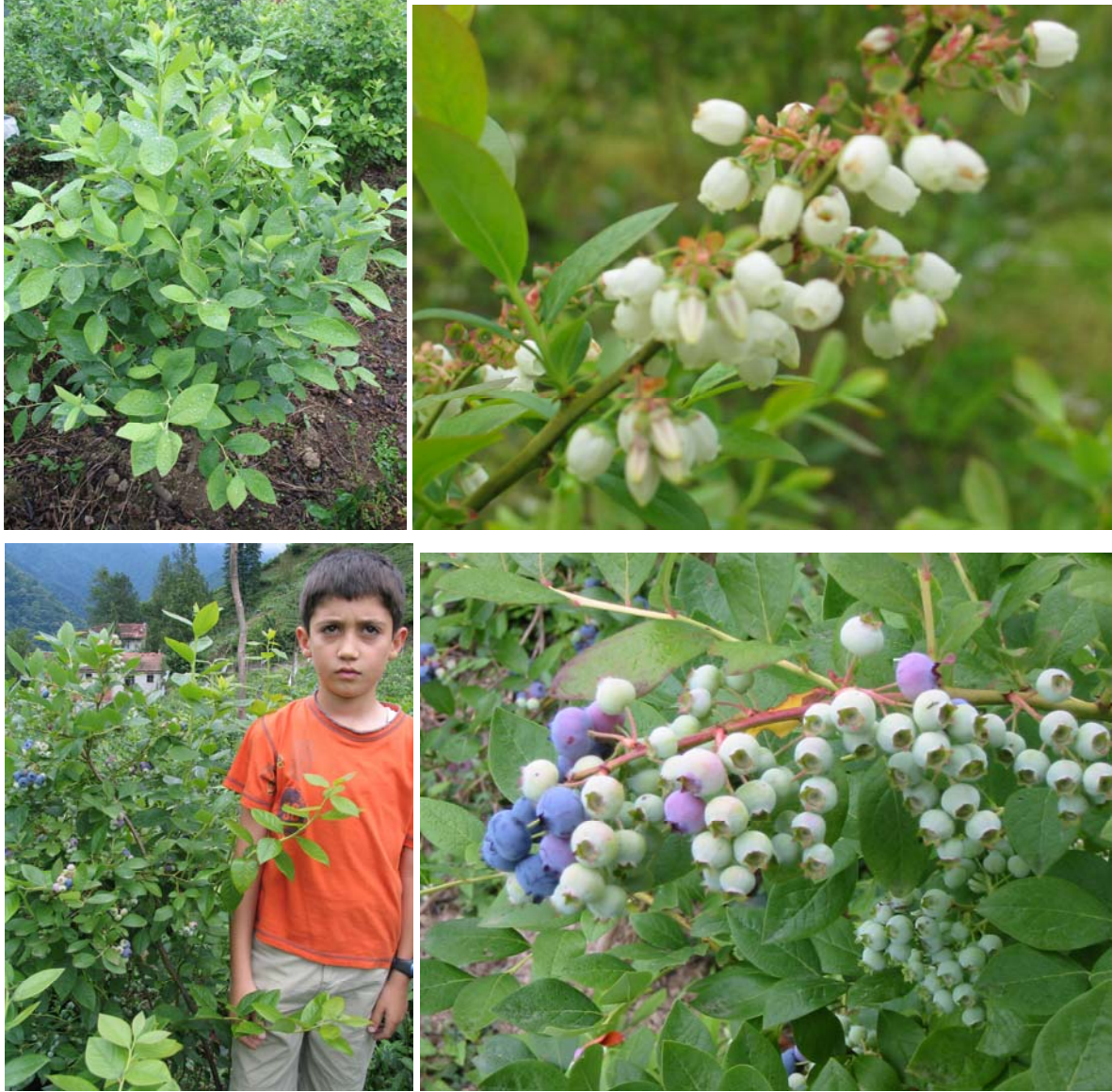
Şekil 1. Likapa bitkisi, dal üzerindeki çiçek salkımları, ilk sürgünler (1. Flaşlar) ve meyveleri

Likapa yetiştirilen alanlar sınırlı olarak artmakta ve 1980 yılında 22340 ha olan likapa ekiliş alanları 2005 yılında 51870 ha'a ulaşabilmiştir. Gelecek on yıl içinde bu alanlarda %20'lik bir artış hedeflenmektedir (Çizelge 1). Çok sınırlı bir artış gösteren dünya likapa üretimi maalesef ihtiyacı karşılayamamaktadır. Dünya likapa alanlarının %10'u Avrupa'da bulunmaktadır. Polonya'da 3600 ha, Almanya'da 1350 ha, İspanya-Portekiz'de 250 ha, İtalya'da 65 ha ve İngiltere'de 15 ha'lık alanda likapa tarımı yapılmaktadır. Avrupa'da likapa dikim alanları hızla artmaktadır. 2003 yılı verilerine göre Avrupa'daki toplam likapa üretimi 10975 ton olup %95'i Avrupa'da taze olarak tüketime sunulmuştur (Çizelge 1 ve 2).